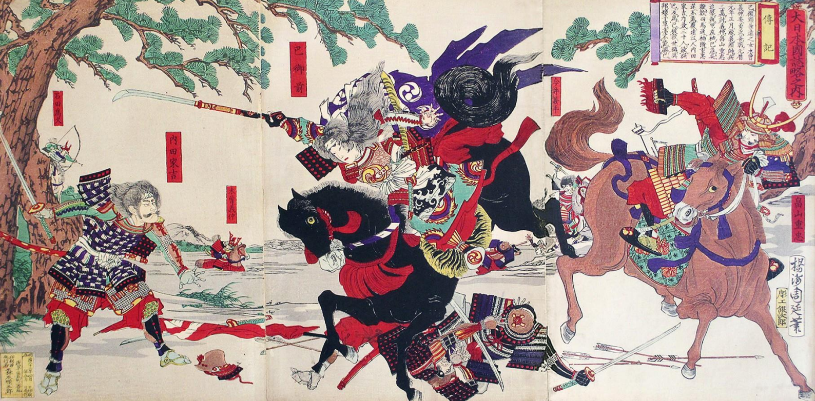
Tomoe Gozen con Uchida Ieyoshi e Hatakeyama no Shigetada. Stampa su legno di Yōshū Chikanobu, 1899